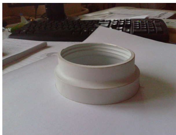
Nr 4 poz.113