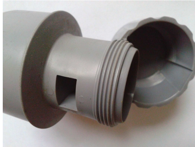
Nr 7 poz. 93