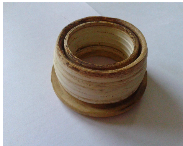
Nr 2 poz. 144