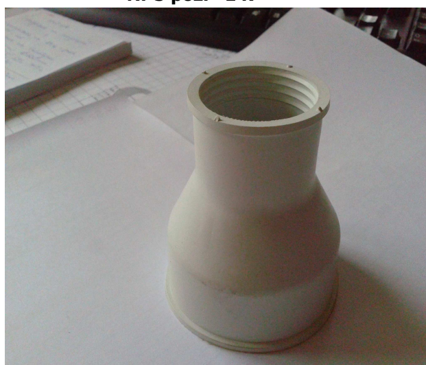
Nr 5 poz. 147