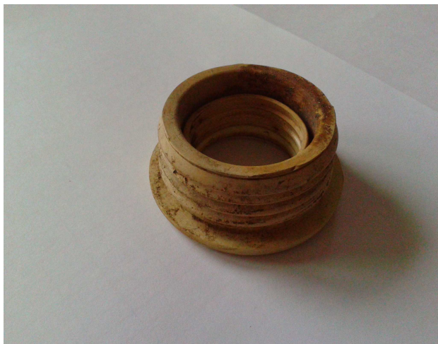
Nr1 poz. 145

Zdjęcia asortymentu określonego w Załączniku Nr 2 do SIWZ formularzu asortymentowo-cenowym w pozycjach: 93,143,144,145,146,147