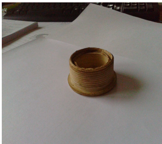
Nr 3 poz. 146